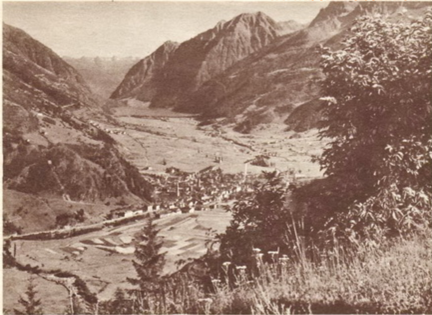
Blick in's Puschlav