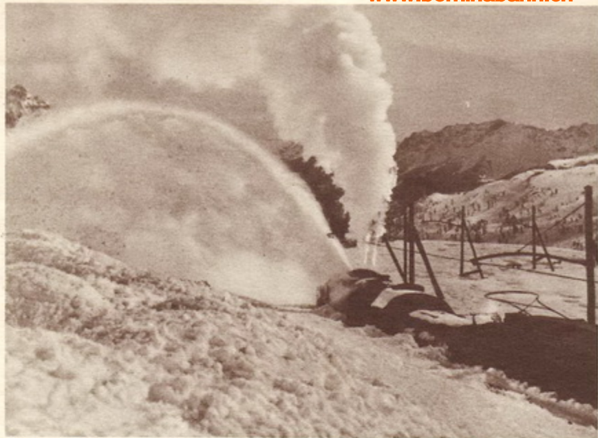
Sneeschleudermaschine der Berninabahn in Tätigkeit

The best route and the most beautiful which from the north of Europe leads to the south is that which goes through the Swiss highlands of the Grisons. The Rhaetian alpine passes, already well known to the ancient Romans who made frequent use of them for their military expeditions to northern countries, served later on the same purpose for the foreign armies which from the north came down to invade the fertile plains of Italy. But, in those times, these passes bristled with difficulties, and the invaders could only avail themselves of rough paths through the wild ravines of these enormous mountains covered with eternal snows.