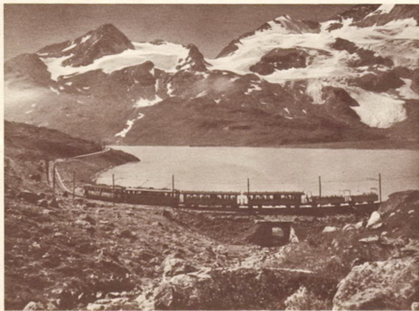
Berninabahn am Lago Bianco (weisser See)