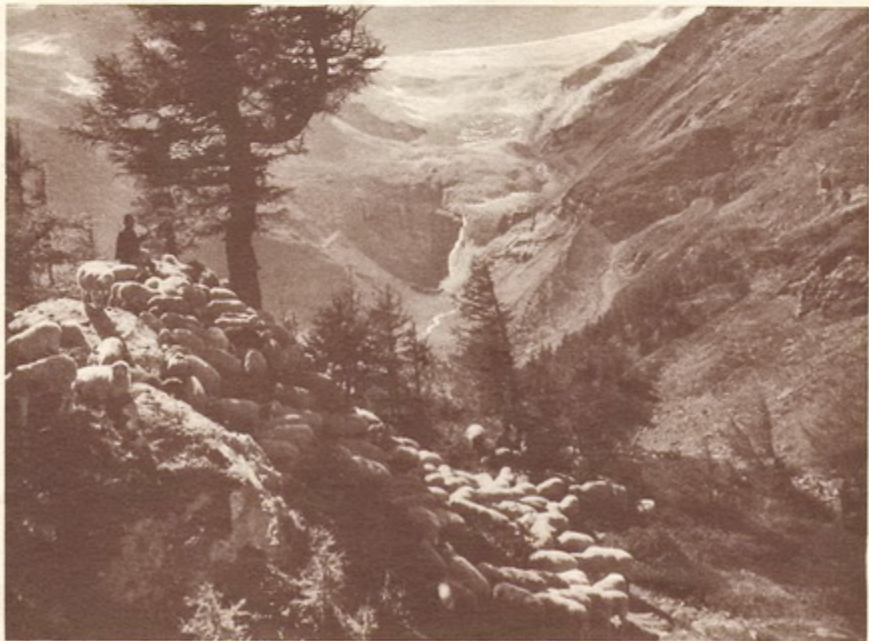
Schafidyll bei Alp Grüm — Blick auf Palüglacier

He who has once experienced the delight which is roused by this marvellous journey will never, all his life, forget it.