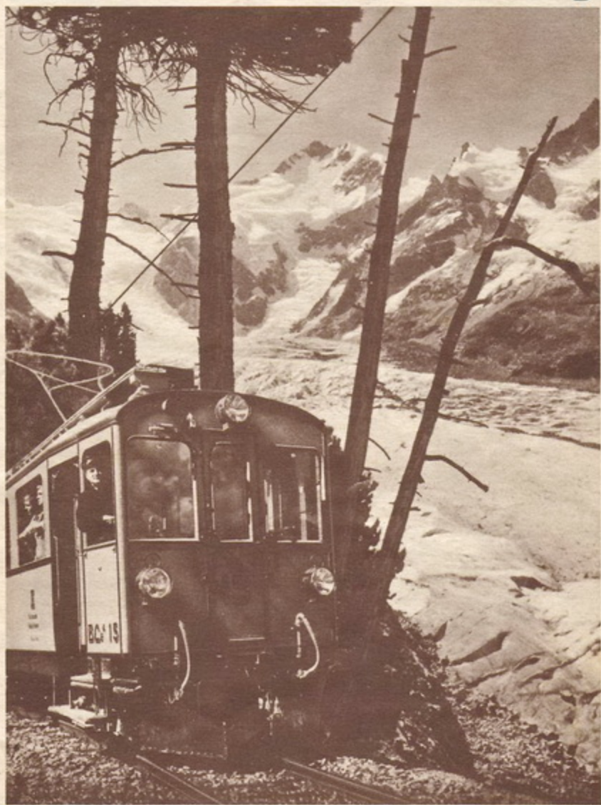
Berninabahn mit Piz Bernino, 4052 m ü. M.