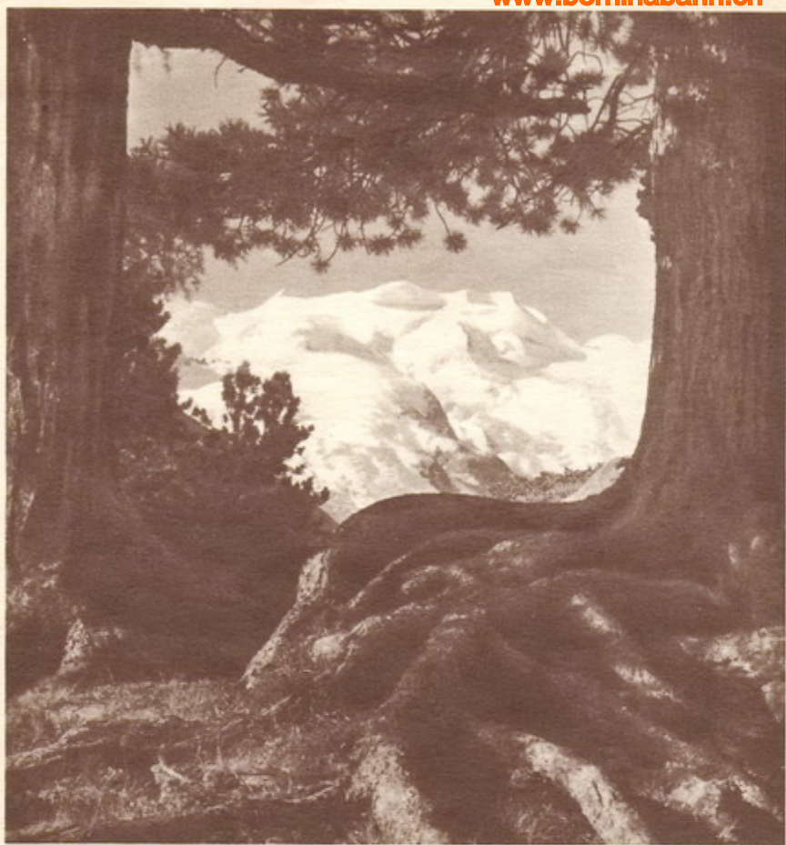
Durchblick auf Bellavista - Berninagruppe

D er schönste Weg von Nord nach Süd, von Deutschland oder Frankreich nach Italien, führt über das schweizerische Hochland von Graubünden, führt durch das Engadin. Es ist auch der kühnste Weg, durchquert er doch die weissen Firne des Hochgebirges und übersteigt er die Alpen in Höhen, die schon über der Grenze des ewigen Schnees liegen. Ihm kommt kein zweiter Alpenübergang gleich. Schon in den ältesten Zeiten ist die Verbindung von Nord und Süd über die Bündnerpässe gesucht worden, und die deutschen Kaiser sind schon diese Pfade gezogen, nachdem der Weg durch die Römer gewiesen war, die auf ihren Eroberungszügen nach Norden die rhätischen Alpenpässe begingen. Sie taten es auf mühsamen Pfaden, durch ein wildes Hochgebirge voll Schreck und Grausen. Heute sind alle Schrecken überwunden. Einer der historischen Bündnerpässe, der schönste und der höchsten einer, trägt den Schienenstrang auf seinem Rücken und man fährt jetzt, rasch und bequem wie unten im Flachland, an den Gletschern vorbei, über den 2256 Meter hohen Pass aus dem Norden nach dem Süden, von Deutschland nach Italien. Oder von England nach Aegypten, wenn man so will. Die Berninabahn hat das Wunder vollbracht und eine Verbindung zwischen Nord und Süd geschaffen, die über die grossartigsten Gebiete der Alpen hinüberführt und die Reise zu einem unvergesslichen Erlebnis macht.