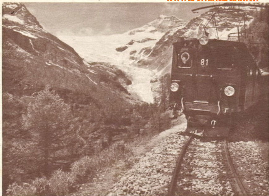
Berninaexpress mit Blick auf Piz Palü, 3912 m und Palüglacier

No other country can furnish in so short a journey such contrasts as those which meet one on the Bernina line. The traveller who a few hours ago left the Cambrena and Palü glaciers, and bid farewell to the majestic alpine coniferae finds at Tirano chestnut trees and vines!